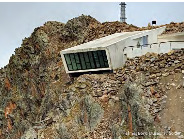
James Bond Museum / Sölden

Transparente und einfache Vernetzung herrscht auch zwischen Produktion, Logistik und Montage. Es kann zu jeder Zeit jeder Schritt genau nachvollzogen und einfach nachverfolgt werden. Durch die zentrale Datenbank stehen alle prozessbezogenen Informationen zur Verfügung und können zum Beispiel für die Erstellung von Nachkalkulationen verwendet werden.