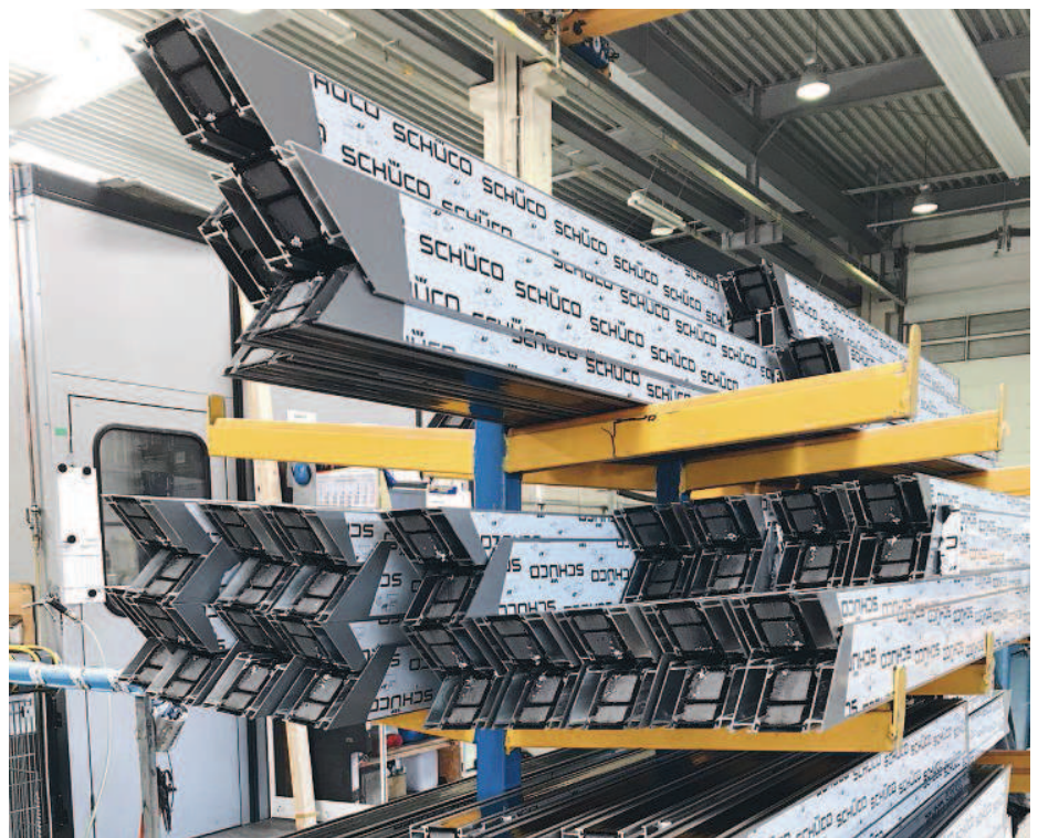
Bereitstellung des Materials für die Elementfertigung mit den Packlisten aus E-R-Plus.

E-R-Plus wird in unserem Unternehmen in allen Abteilungen eingesetzt. Das beginnt bei der