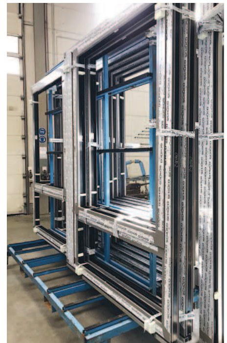
Logistische Herausforderung: E-R-Plus unterstützt die perfekte Vorbereitung für die Montage mit der VersandApp.

Das System garantiert eine nahtlose Ablauforganisation. Uns gefällt die Integration von branchenbezogenen Erfordernissen, beispielsweise die Live-Schnittstellen zu den branchenüblichen Kalkulationsprogrammen. Unsere Arbeit wird dadurch deutlich erleichtert. Projektbezogene Informationen sind jederzeit abrufbar. Dank der Filter- und Erinnerungsfunktionen werden Probleme in der Bereitstellung von Material, Personal und Betriebsmitteln schnell sichtbar. Man merkt deutlich, dass hinter dem System jahrelange Erfahrung steckt. Ohne E-R-Plus wären die Abläufe viel komplizierter und langsamer, der technische Standard entspräche nicht den heutigen Anforderungen. ■